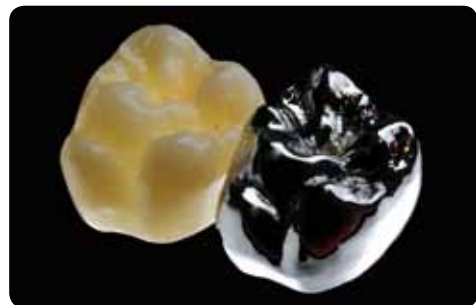
IPS e.max Press Krone im Vergleich zu einer Vollgusskrone W. Weisser, Deutschland