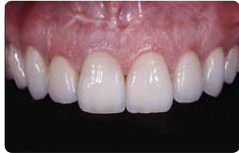
Komplettversorgung mit IPS e.max Press Prof. Dr. D. Edelhoff / O. Brix, Deutschland

Wählen Sie in Absprache mit Ihrem Labor je nach Patientenfall den passenden Weg: eine kostengünstige, vollanatomische Restauration, die eine wirtschaftliche und ansprechende Alternative zur Vollgusskrone darstellt. Oder die exklusivere Variante, die mittels der Cut-back- und Schichttechnik gefertigt wird und auch den höchsten ästhetischen Ansprüchen Ihrer Patienten gerecht wird.