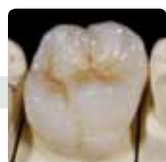
Vollanatomisch bemalt und glasiert