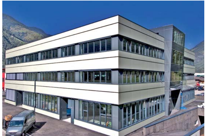
Zirkonzahn Hauptsitz in Gais